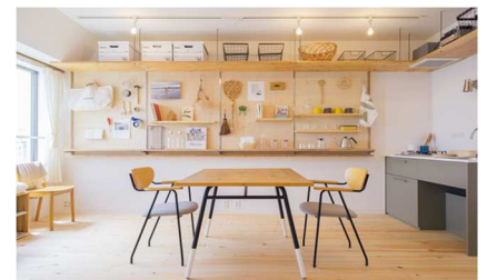
T×HAPTIC with HANDSイメージ （床材はヒノキ）

賃貸住宅では希少である無垢材の中でも、床材として人気のあるヒノキ（国産）を使用することで、さらなる快適な住空間の提供を目指します。 また、現在床材として選択可能な「カバザクラ」「ヤマグリ」「オーク」のうち、2018年3月末日までは、キャンペーン期間として、「ヤマグリ」「オーク」と同価格で「ヒノキ（国産）」を提供します。