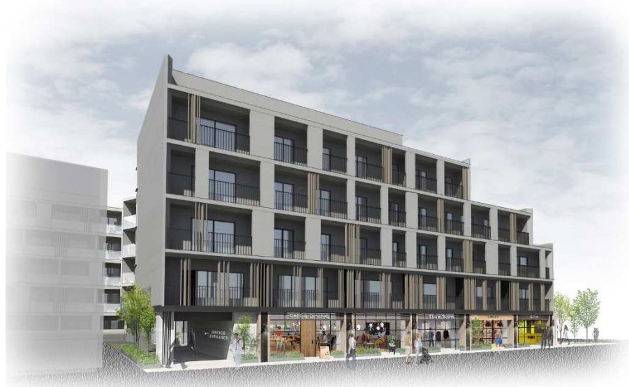
▲東側（店舗・オフィス）外観イメージ

本計画は、東急東横線「中目黒」駅徒歩7分の目黒区青葉台1丁目に、地上5階建、約1,560坪の複合施設を新築するもので、2021年1月末に竣工、2月オープン予定です。周辺は飲食店、アパレルが軒を連ねるエリアでありながら、閑静な住宅が立ち並び、利便性の高さで住環境に優れています。その立地特性を活かし、レジデンス、スモールオフィス、ショップからなる複合施設を計画しました。