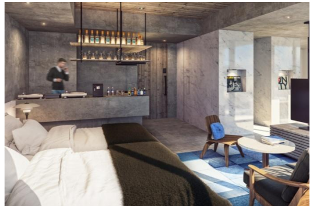
PREMIUM TERRACE ROOM イメージ