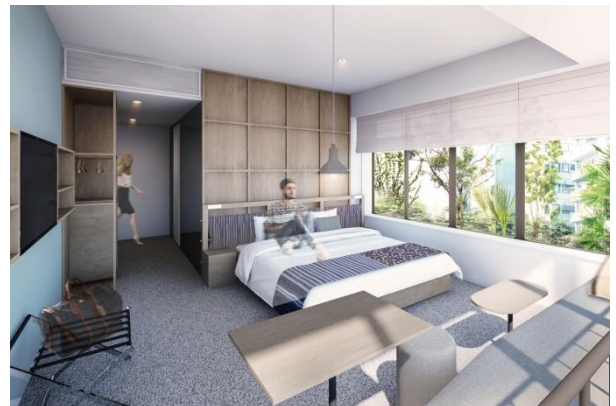
CORNER DOUBLE ROOM イメージ