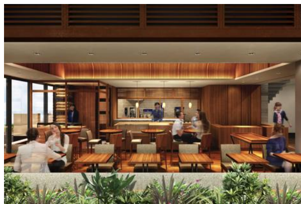
チョコレートショップイメージ